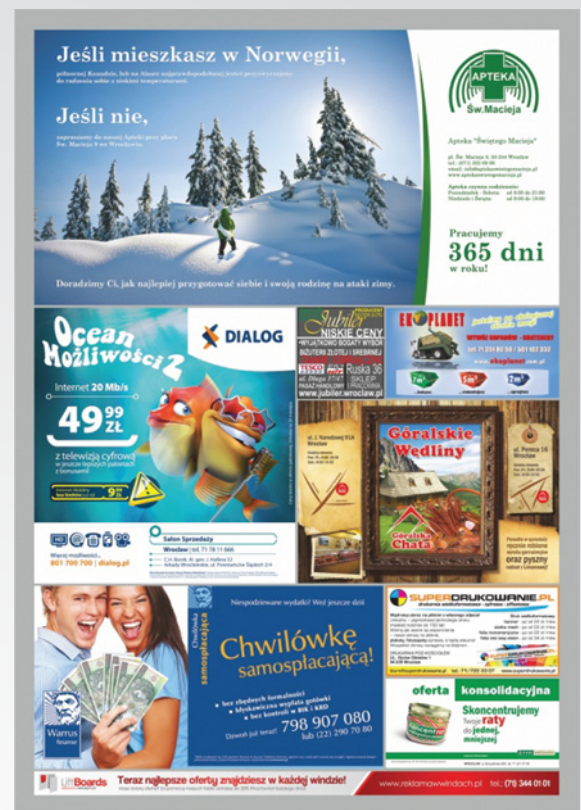
wizualizacja nośnika LIFTBOARDS