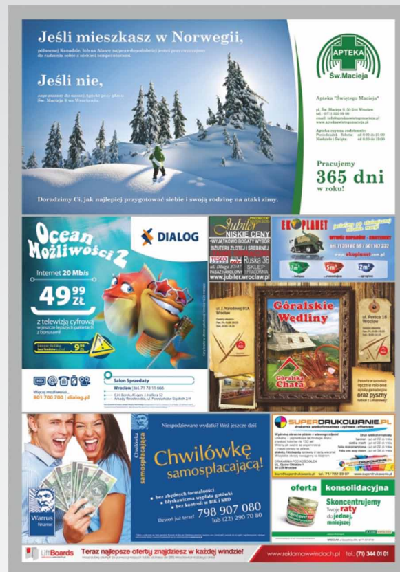
wizualizacja nośnika Liftboards

Obecnie posiadamy 2072 nośniki , które umieszczone są na osiedlach mieszkalnych w dziesięciu dużych miastach: Warszawa, Wrocław, Poznań, Katowice, Kraków, Łódź, Częstochowa, Bielsko-Biała, Sosnowiec, Gorzów Wielkopolski, Stargard Szczeciński, Pabianice i Włocławek